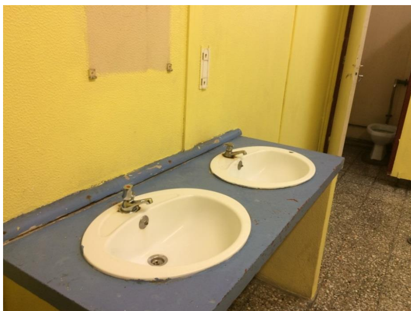
Lavatórios sem espelhos