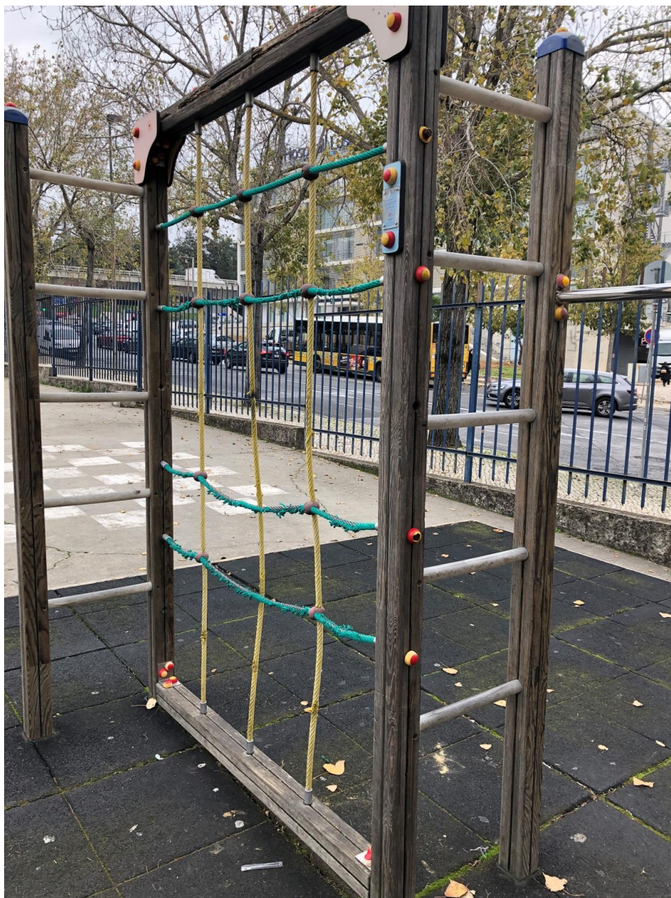
Equipamento 2 danificado