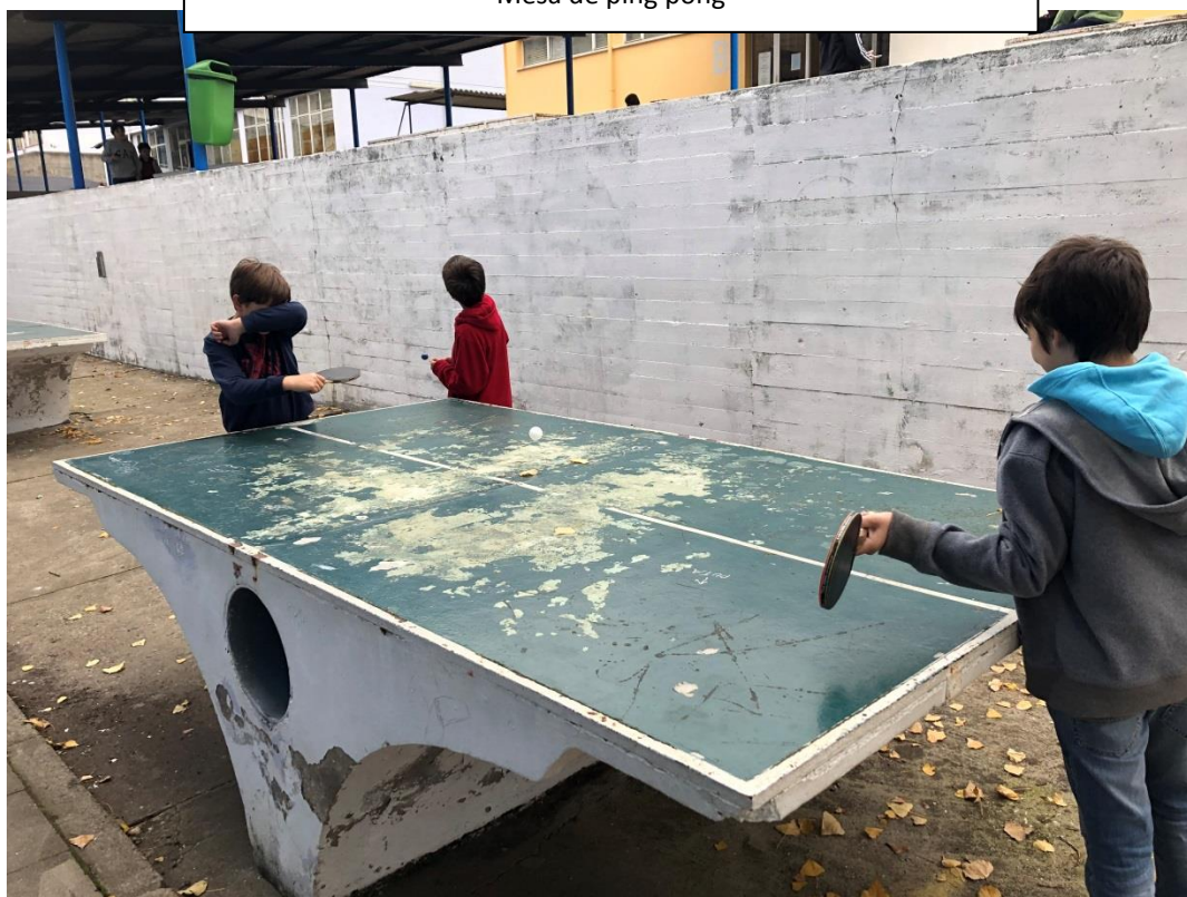
Alunos a jogar sem rede