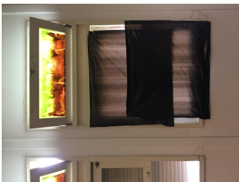
Janelas com plástico para isolar o calor