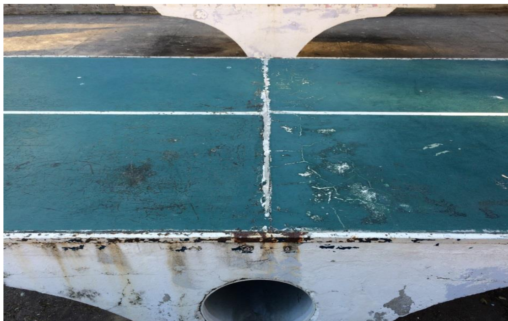
Mesa de ping pong