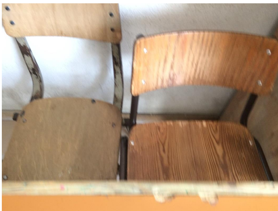
Cadeiras velhas e de tamanhos diferentes