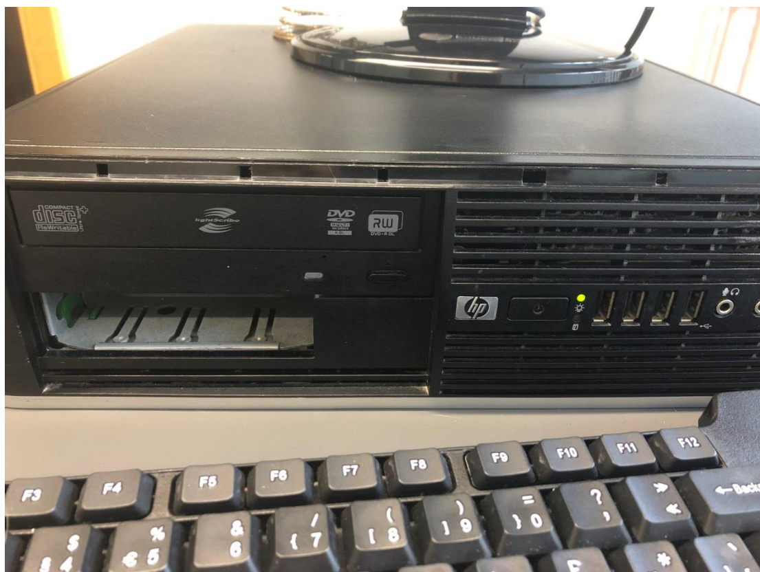
Exemplo de desk top existente