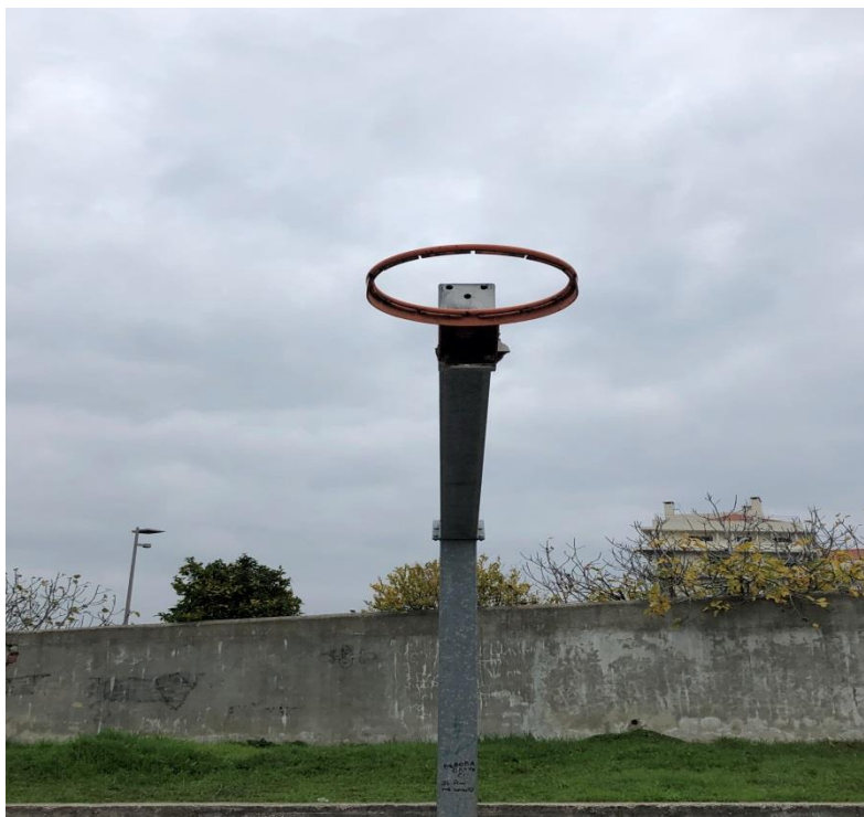
Tabela de basquetebol danificada