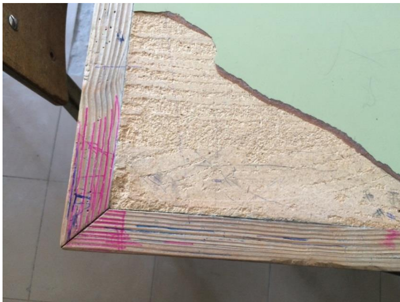
Mesa de uma sala