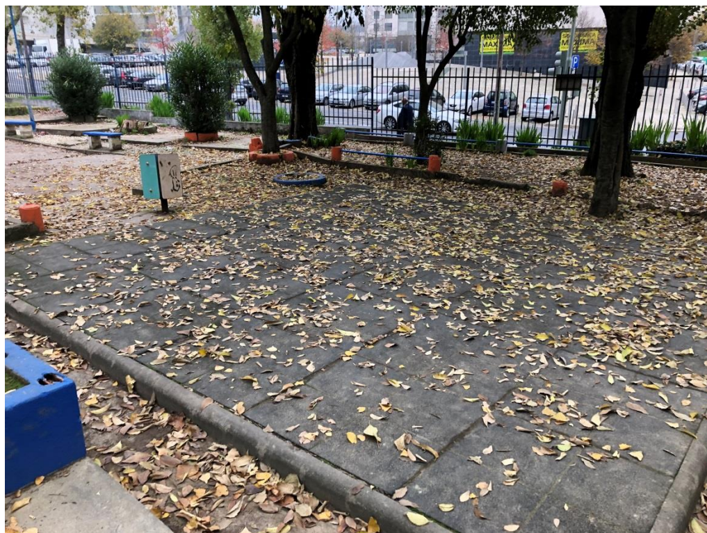
Local onde estava colocado o equipamento retirado