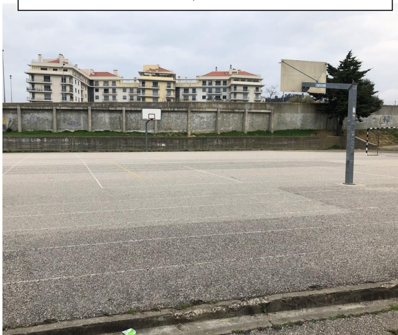
Marcações campo sumidas