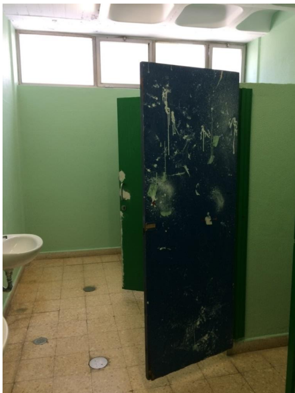
Portas das instalações sanitárias